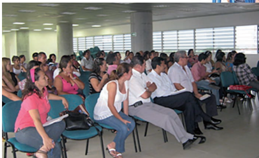
Capacitación libro fiscal y responsabilidad régimen común y simplificado.