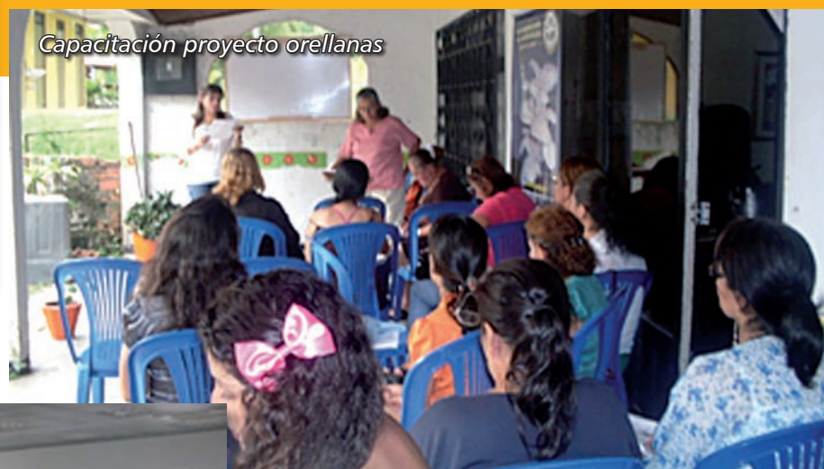
Capacitación proyecto orellanas