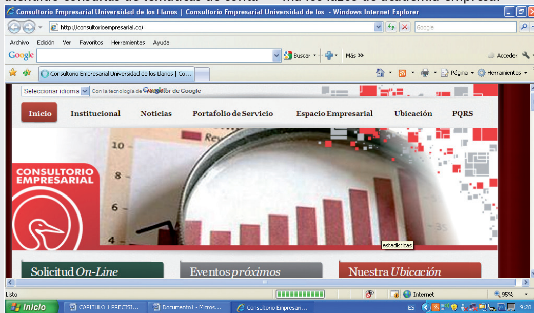
Portal web del Consultorio Empresarial UNILLANOS.

UNILLANOS responde de esta forma a las necesidades de su contexto investigándolo, entendiéndolo y brindando alternativas de solución estrechando de esta forma los lazos de academia-empresa.