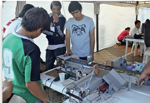
Banda Transportadora selectora con cilindros neumáticos. Universidad De Los Llanos

sión, en la oportunidad más grande a nivel regional que tiene la ingeniería para exponer sus avances en las diferentes áreas de desarrollo. Los grupos de Investigación de la FCBI de UNILLANOS: Macrypt y GIRO, presentaron los avances en sus proyectos, agregando un triunfo más a su desempeño investigativo, reconocidos por Colciencias en categoría D.