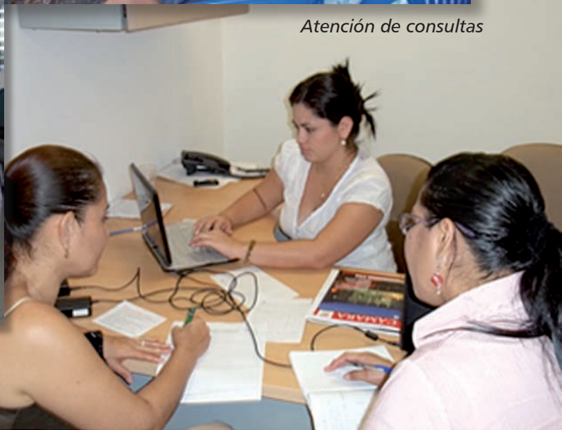
Atención de consultas