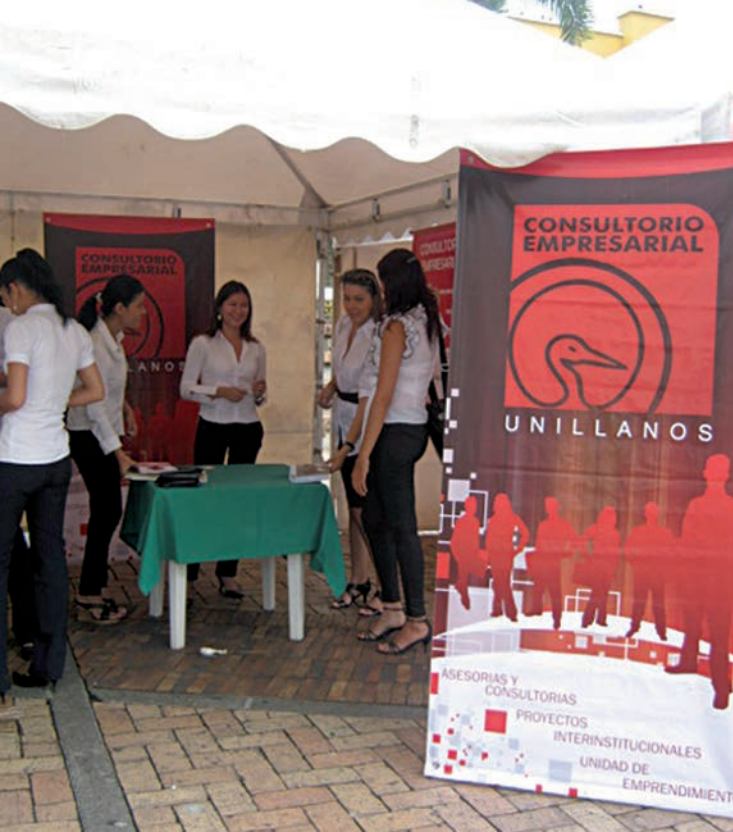
Participación de consultorio empresarial en la feria de Bandesa 2011.

Proyectos interinstitucionales: son los convenios desarrollados con otras instituciones para realizar y ejecutar proyectos que benefician a los empresarios, gremios o comunidad en general.