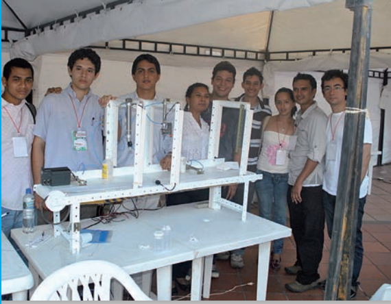
Automatismo para envasado y sellado de recipientes, presentado por los estudiantes del curso de Automatización de La Universidad de los Llanos.

El pasado 27 de mayo se llevó a cabo en la plazoleta de eventos de La Sabana Centro Comercial, la Tercera Muestra Regional de Proyectos de Ingeniería . La realización de este evento estuvo a cargo del Centro de Proyección Social de la Facultad de Ciencias Básicas e Ingenierías de la Universidad de los Llanos. En el evento participaron además de UNILLANOS, la Universidad Militar Nueva Granada, la Distrital Francisco José De Caldas, la Corporación Universitaria del Meta, la Universidad Antonio Nariño, la Fundación CIDCA y el Colegio Técnico Industrial. Las áreas de desarrollo de la muestra fueron: Automatización, Instrumentación y Bioingeniería.